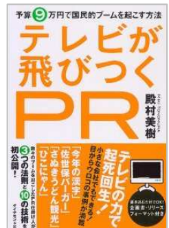
『テレビが飛びつくPRー予算9万円で国民的ブームを起こす方法ー』（ダイヤモンド社刊）

関西大学社会学部「広報論」講師、独立行政法人中小企業基盤整備機構・経営支援アドバイザー（PR戦略専門家）なども務める。「大金を投じなくてもPRはできる」という信念の下、大手広告代理店とは一線を画す発想が注目を集めている。現在、「心に響くPR戦略」をテーマに活動。これまでの代表的な仕事は、「今年の漢字」プロデュース、「佐世保バーガー」「さぬきうどん観光」「ひこにゃん」の全国PR戦略など。2010年、日本の伝統文化をPR戦略で復興させる「豊新市場開拓プロジェクト」で「PRアワードグランプリ ソーシャルコミュニケーション部門 最優秀賞」受賞。